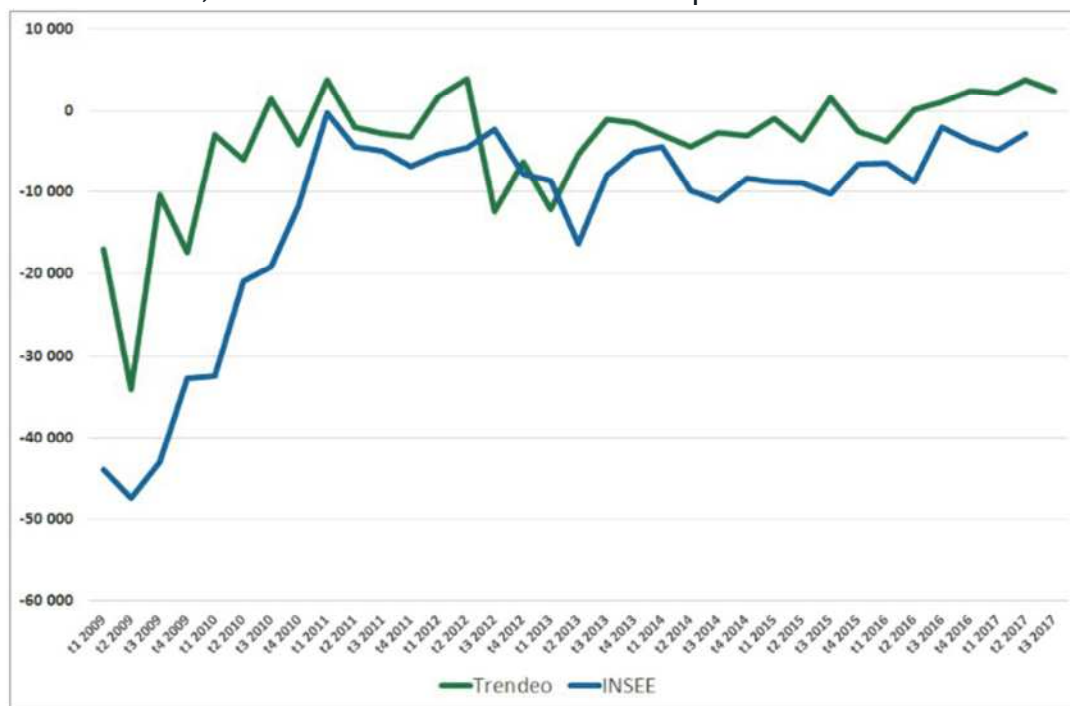
Données INSEE : Emplois salariés trimestriel – Industrie – Sections B, C, D et E données CVS – Identifiant 001577235

Le phénomène est assez rare pour être remarqué : depuis le début de l'année, la France a créé plus d'usines (87) qu'elle n'en a perdu (61) ! Avec, pour conséquence, un secteur manufacturier qui détruit de moins en moins d'emplois, voire, selon certaines sources, commence à être créateur net de postes 1 .