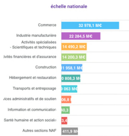
Top 10 des prêts garantis par l'Etat ventilés par code section NAF (en M€)

En termes géographiques, l'Ile-de-France figure en numéro un, avec 51 572 millions d'euros, soit 37% du montant total des PGE pour 30,8% du PIB, suivie par Auvergne Rhône-Alpes (15 399 millions d'euros, 11% des montants pour 11,6% du PIB) et Provence Alpes-Côtes d'Azur (11 549 millions d'euros. Soit 8,4% des montants pour 7,1% du PIB). Les Hauts-de-France et la région Grand Est bénéficient aussi de montants bien plus significatifs que les régions occidentales de l'hexagone.